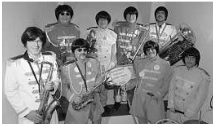
Berühmte Pilzköpfe zu Besuch in Wolfach! Beim Zunftball 2020 begeisterten die „Biermösel“ ihr Publikum mit Songs des legendären Beatles-Albums „St. Pepper's Lonely Hearts Club Band“.

Die Veranstaltung beginnt um 19.00 Uhr. Bei schlechter Witterung findet das Picknick in der Schlosshalle statt. Für ausreichend feste Sitzgelegenheiten ist dank Stühlen, Bänken und Tischen gesorgt, Voranmeldungen sind nicht erforderlich. Die aktuellen Corona-Vorschriften müssen eingehalten werden. Der Eintritt ist wie immer bei „Mittwochs im Museum frei“; um Spenden für Getränke und Künstler wird gebeten.