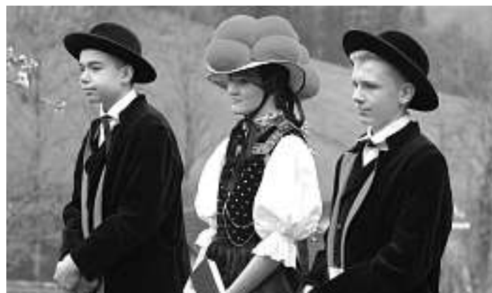
Die Kirnbacher Konfirmanden werden wie in 2017 (siehe Bild) auch in diesem Jahr an ihrem Festtag die berühmte Tracht tragen.

Es gelten den gesamten Tag die Bedingungen der Coronaregeln.