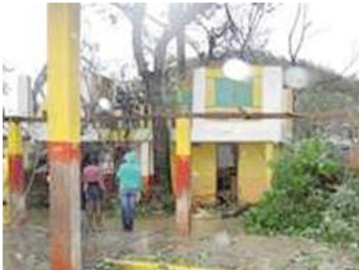
Nach dem Hurrikan: Halle und Dächer sind komplett zerstört, Bäume liegen am Boden, alles ist durchnässt.