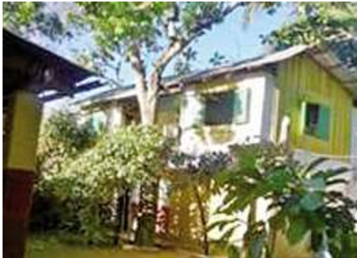
Vor dem Hurrikan: Links ist die Ecke der Halle zu erkennen

Molekül Frucht drin ist. Mittlerweile schaffen wir es, sehr teuer aus der nächsten großen Stadt ein paar Pampelmusen zu ergattern, das reicht dann für jedes Waisenkind einmal in der Woche einen halben Becher Saft. Für die Schüler hatten wir Pampelmusen im Neujahrspaket, hat ein Vermögen gekostet.“