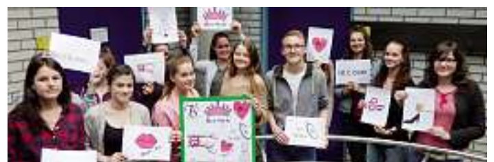
Schüler-/innen des Wolfacher SG11 präsentieren Ihre neu gestalteten Logos

Später soll das selbst gestaltete Markenlogo auch auf das eigene Modeplakat, das die Schüler-/innen im Verlauf des weiteren Schuljahres noch eigenständig konzipieren und umsetzen werden.