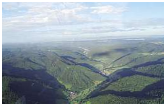
Blick aufs obere Kinzigtal mit dem Ippichental und Halbmeil im Vordergrund.