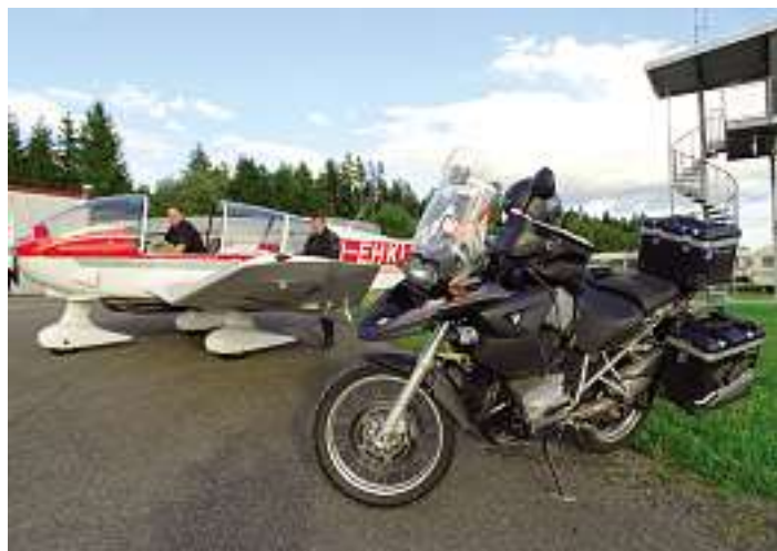
Der Luftsportverein Schwarzwald verfügt über mehrere moderne Viersitzer.